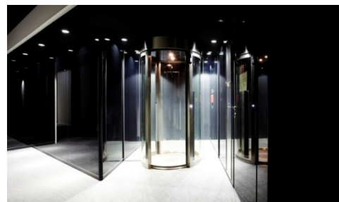
サーバールーム入口に設置された パーソナル・インターロック (PIL-S01)