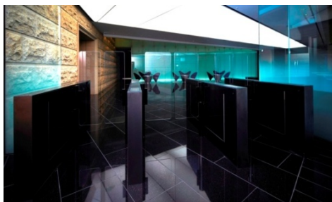
エントランスロビーに設置された ハーフハイト・センサーバリア (HSB-S05)

GDC御殿山は、堅牢性の向上、快適なワークスペースの提供、高度なセキュリティ・安全性を追求し、エントランスロビー、サーバールーム入口、ビル通用口での入退室管理としてKabaセキュリティゲートが設置されています。導入されたセキュリティゲートは、パーソナル・インターロック PIL S01、フラップドア式ゲート HSB S05、HSB E08です。