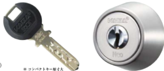
※コンパクトキー取付大